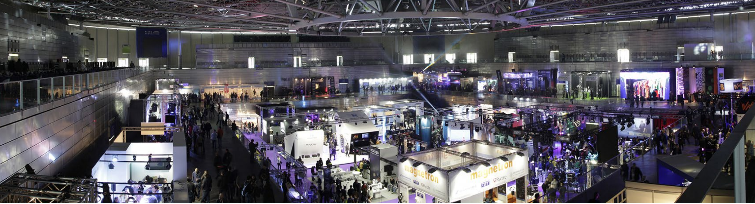
Vista panorámica de Afial 2014 desde el nivel superior

Gracias a todos, expositores y visitantes, por participar en esta edición.