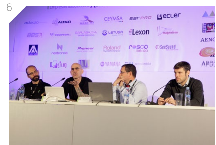
Algunos momentos de las conferencias: | 1 - Mesa redonda Educación de la iluminación | 2 - Pintando con la luz | 3 - La luz en el teatro Musical, caso Billy Elliot | 4 - Todo es formación... si uno quiere | 5 - Experiencias multisensoriales en sitios arqueológicos | 6 - La normativa del rigging y la madre que la parió