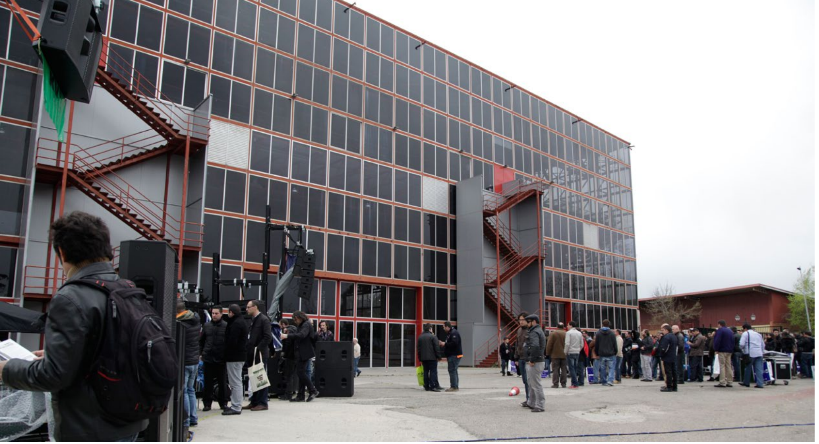
Explanada anexa al Palacio de Cristal donde tuvieron lugar las demostraciones de audio al aire libre