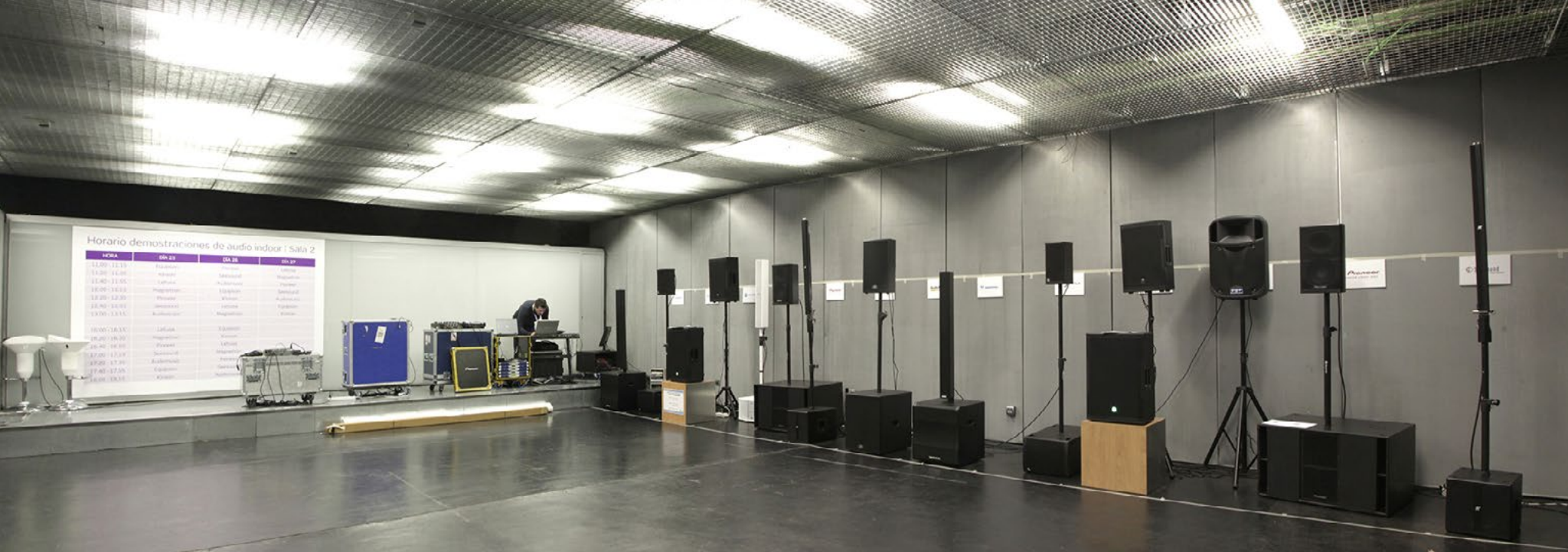
Sala de demos indoor con la distribuci3n de equipos